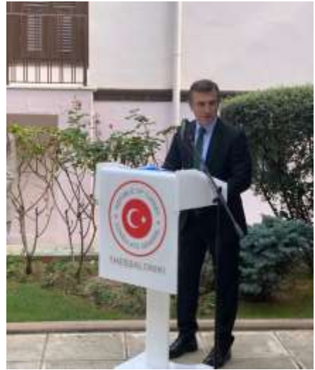
Εικόνες 7- 13| 10.10.2022 Δεξίωση στο Γενικό Προξενείο Τουρκίας & ξενάγηση στο μουσείο Κεμάλ Ατατούρκ