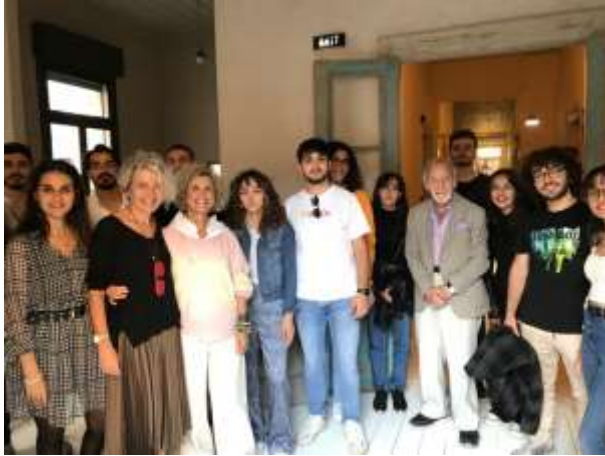
Εικόνα 1 | 09.10.2022 Kick-off meeting