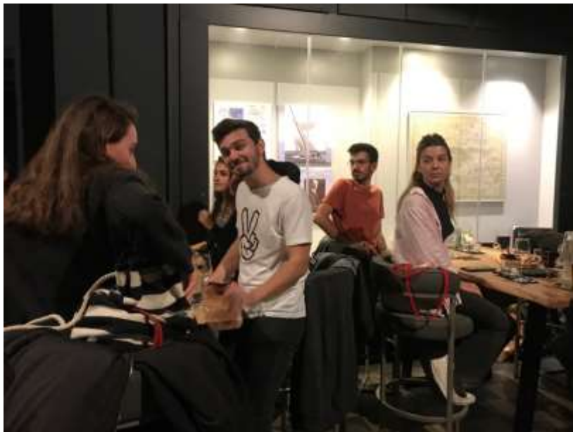
Εικόνα 26 | 12.10.2022 δεξίωση στο Maritime Museum & Café από την Παγκόσμια πολιτιστική Κοινότητα Ελληνισμού