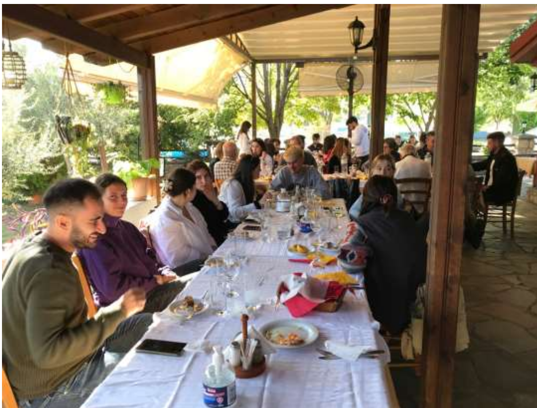
Εικόνα 45 | 15.10.2022 αποχαιρετιστήριο γεύμα