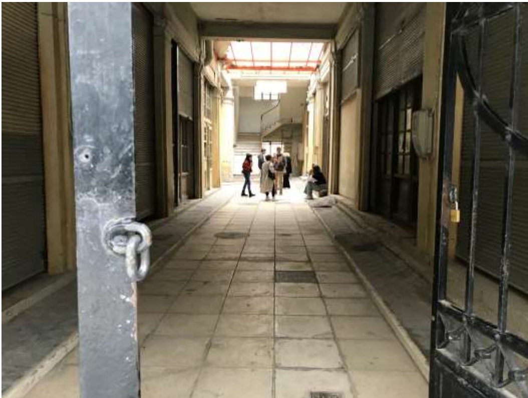
Εικόνες 21-22 | 11.10.2022- 13.10.2022 φοιτητές κατά τη διάρκεια της εργασίας τους στο ΥΨΙΛΟΝ & σε εργασία πεδίου