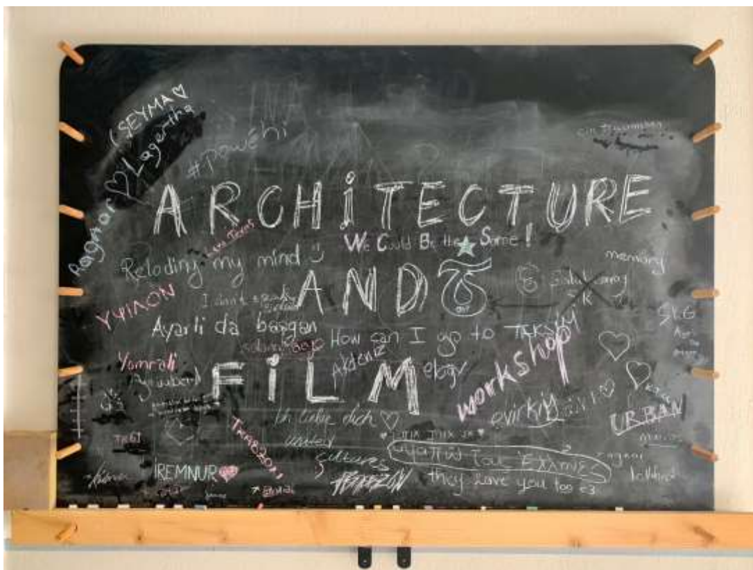
Εικόνα 41 | Πίνακας στους χώρους εργασίας του ΥΨΙΛΟΝ