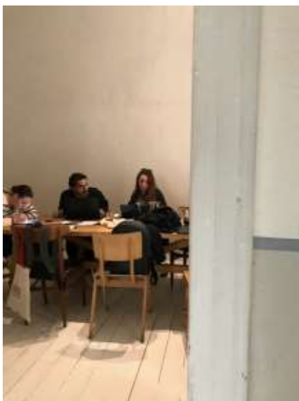
Εικόνα 5 | εργασία στο ΥΨΙΛΟΝ