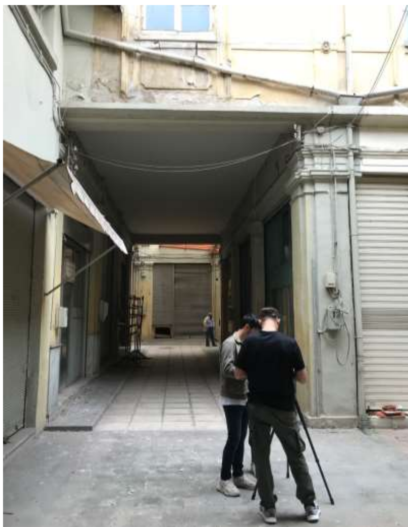
Εικόνες 23-24 | 11.10.2022- 13.10.2022 φοιτητές κατά τη διάρκεια της εργασίας τους στο ΥΨΙΛΟΝ & σε εργασία πεδίου