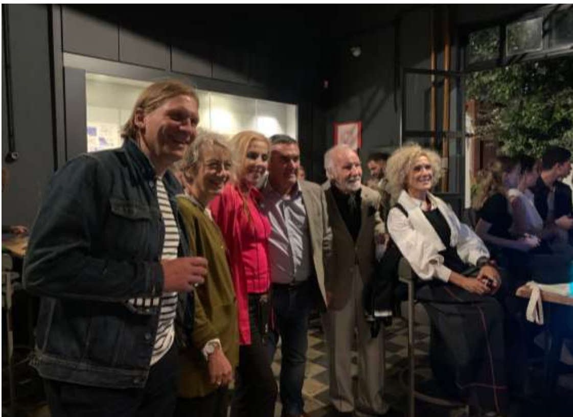
Εικόνα 31 | 12.10.2022 δεξίωση στο Maritime Museum & Café από την Παγκόσμια πολιτιστική Κοινότητα Ελληνισμού