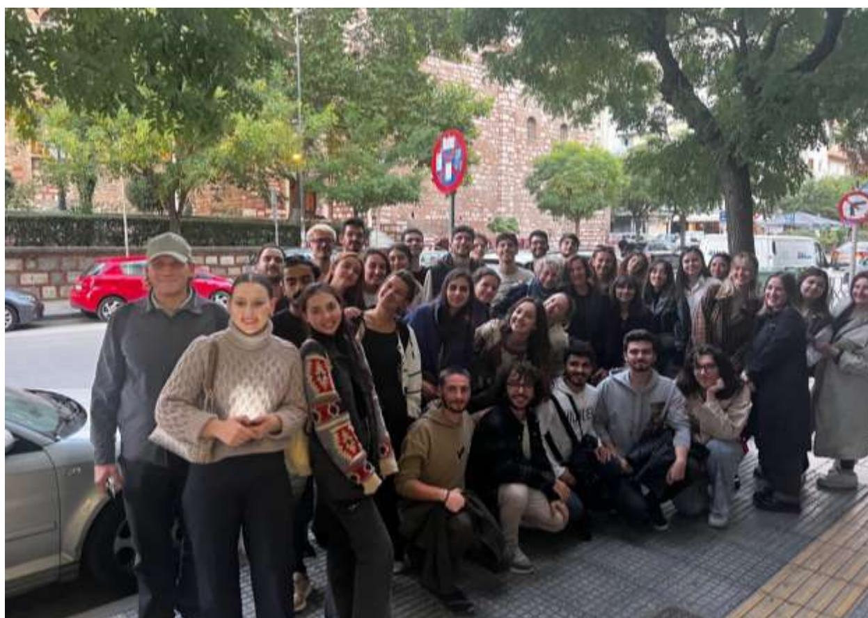
Εικόνα 47 | 15.10.2022 Αποχαιρετισμός στη Θεσσαλονίκη