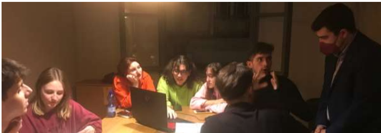
Εικόνες 18-20 | 11.10.2022- 13.10.2022 φοιτητές κατά τη διάρκεια της εργασίας τους στο ΥΨΙΛΟΝ & σε εργασία πεδίου