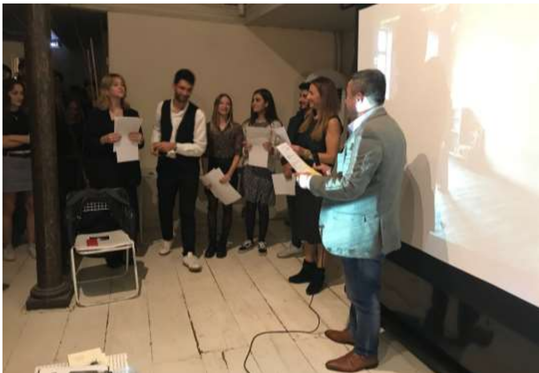
Εικόνα 40 | 14.10.2022 Τελετή λήξης