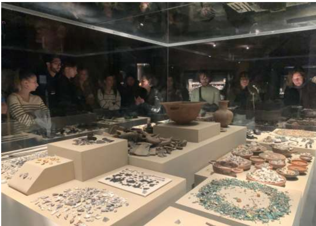
Εικόνα 44 | 15.10.2022 εκδρομή στη Βεργίνα , επίσκεψη στο Μουσείο Βασιλικών Τάφων