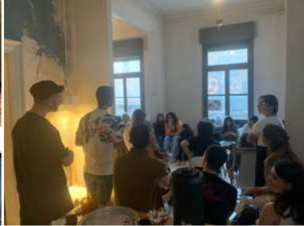
Εικόνα 2 | 09.10.2022 Kick-off meeting