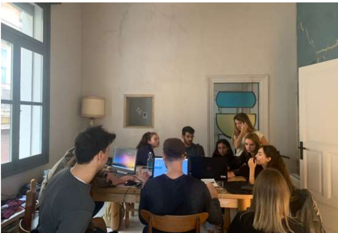
Εικόνα 32 | 11.10.2022- 13.10.2022 φοιτητές κατά τη διάρκεια της εργασίας τους στο ΥΨΙΛΟΝ