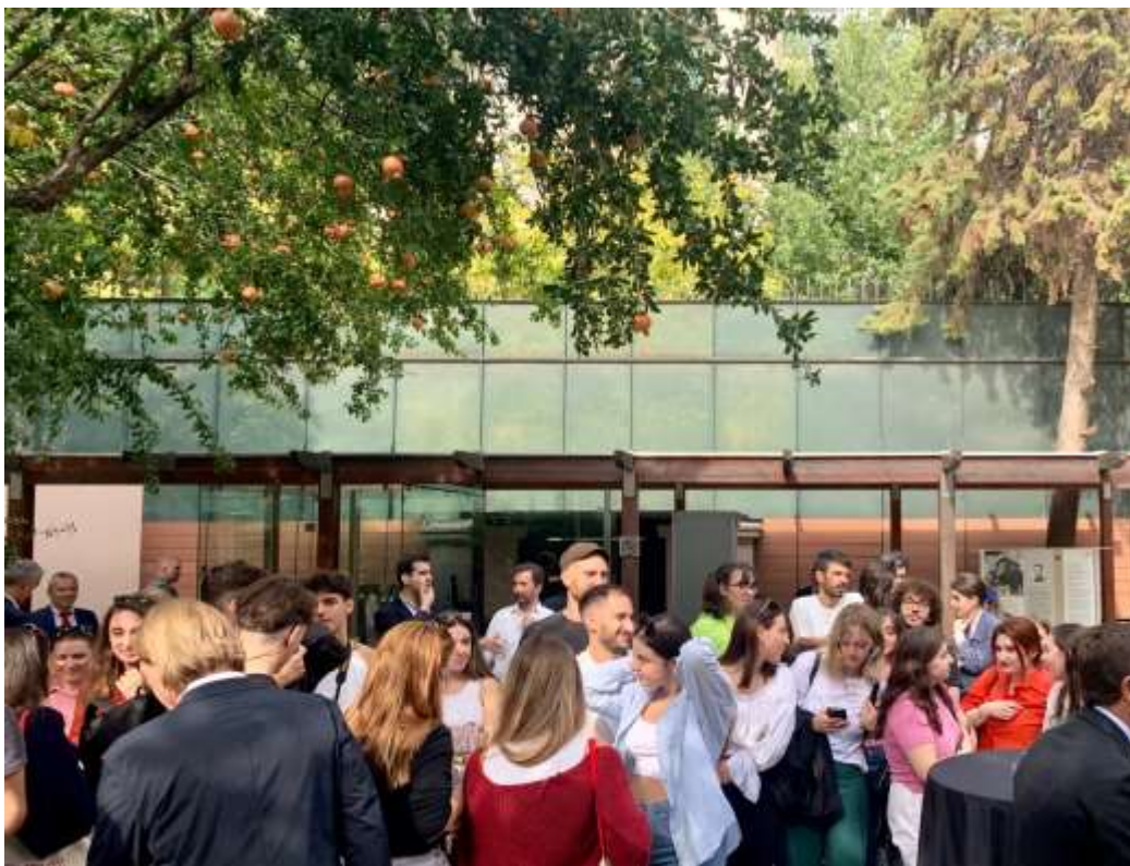
Εικόνα 14 | 10.10.2022 Δεξίωση στο Γενικό Προξενείο Τουρκίας