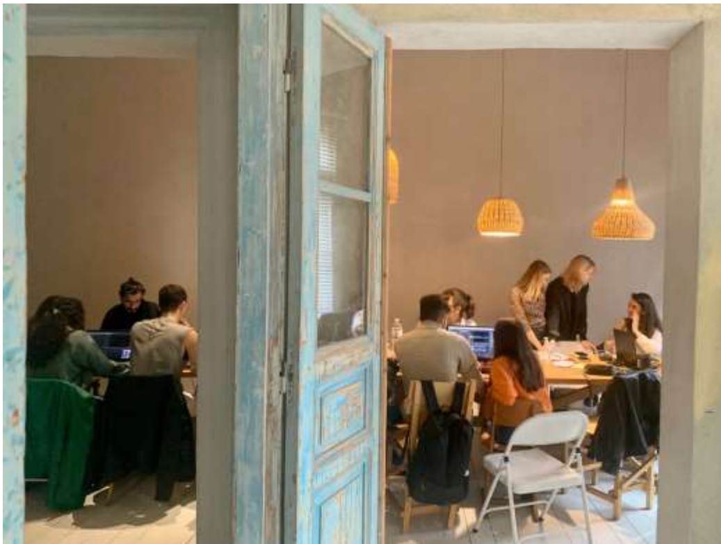
Εικόνα 15 | 11.10.2022 εργασία στον πολυχώρο ΥΨΙΛΟΝ