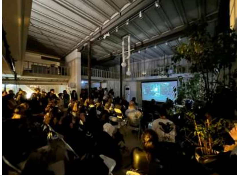
Εικόνες 37-39 | 14.10.2022 Τελετή λήξης