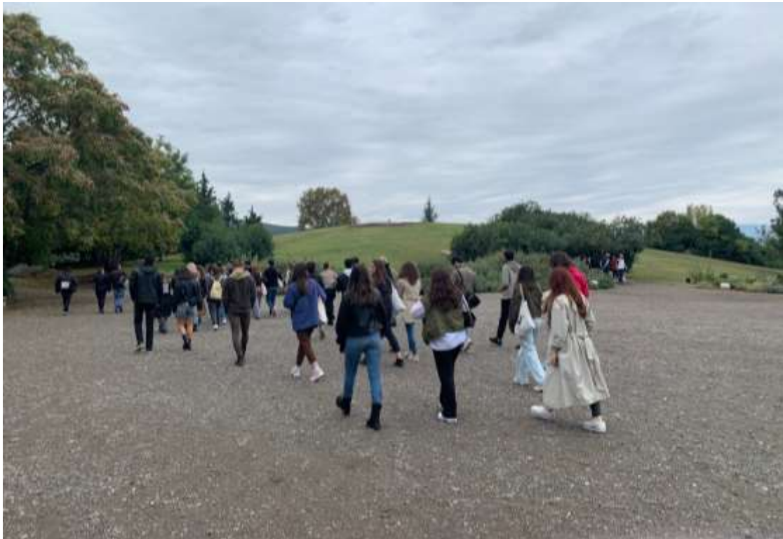
Εικόνες 42-43 | 15.10.2022 εκδρομή στη Βεργίνα , επίσκεψη στο Μουσείο Βασιλικών Τάφων